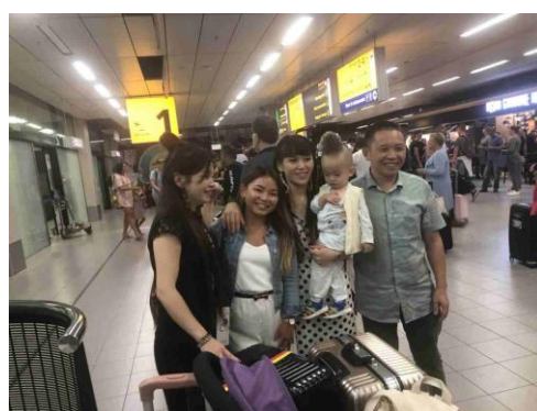
Ontmoeting op Schiphol, eindelijk naar 11 jaar voet op Nederlandse bodem