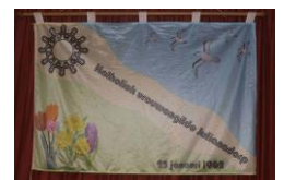
Katholiek Vrouwengilde in Julianadorp