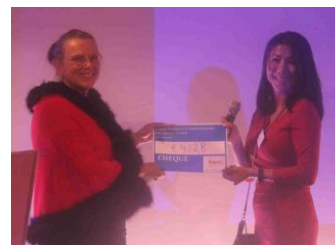
Het moment dat het bedrag bekend werd gemaakt. € 4128 is er opgehaald voor Stichting Eline de Cirkel is Rond