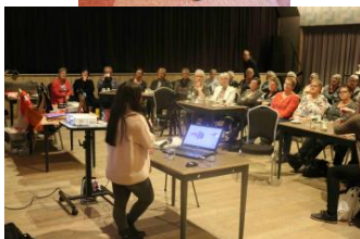
Lezing bij de Vrouwenvereniging "de Passage" in Middenmeer