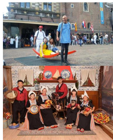
Kaasmarkt Alkmaar en Volendam